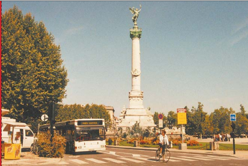
写真2 ジロンド派記念碑