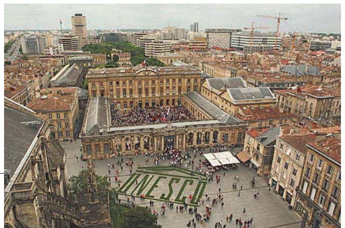
写真-9 ユネスコ世界遺産認定を祝う市庁舎前のイベント