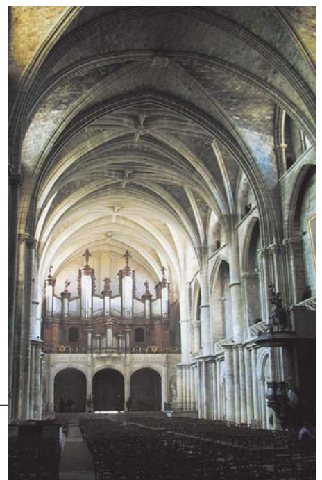
写真-3 サン・タンドレ大聖堂内部

ボルドーを代表する宗教的モニュメントは、サン・タンドレ大聖堂(cathédrale St-André)とサン・ミッシェル教会(Basilique Saint-Michel)が双璧をなしている。サン・タンドレ大聖堂はボルドー最大の教会で、ロマネスク時代の遺構は身廊(入口から内陣にいたる中央部分)に一部残されているがほとんどはゴシック時代のものである(写真-3)。先に触れたルイ7世とアリエノールの結婚式はここでござかに執り行われた。