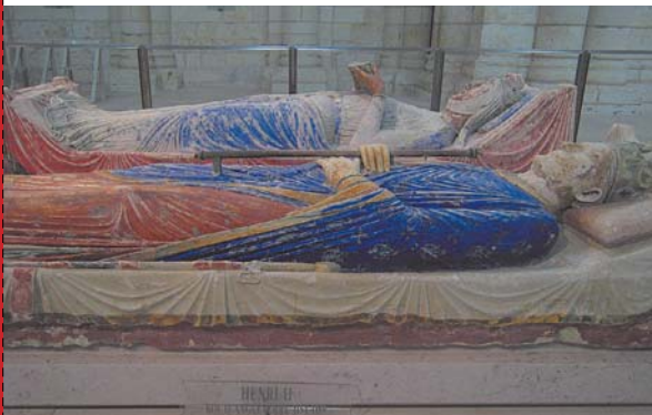
写真-1 フォントヴラウ修道院に安置されたヘンリー2世とアリエノールの墓

ボルドーはフランスのなかでもパリを中心とする伝統的で因習的な地域から地理的に隔絶していたこともあって、コスモポリタンにして自由で闊達な思想を育てる培養基になった。そのことは、3人のMと呼ばれるモンテスキュー(Montesquieu、18世紀の法学者、「三権分立論」を唱えた)、モンテーニュ(Montaigne、16世紀の哲学者、主著に『エッセー(随想録)』)、モーリアック(Mauriac、20世紀フランスを代表する文学者、