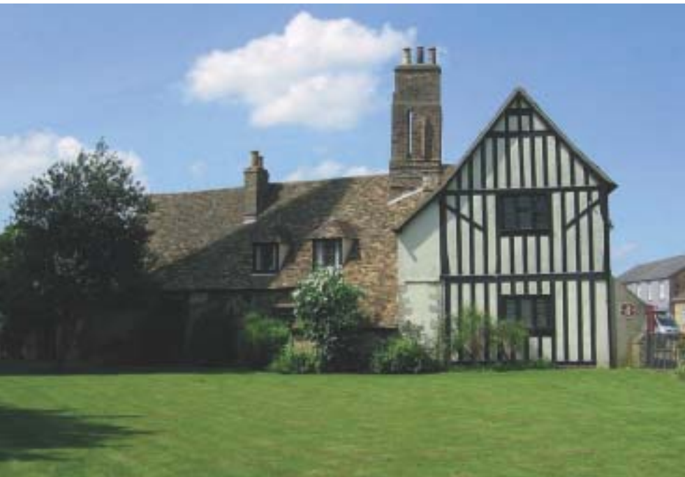
写真5 クロムウェルの住宅

イーリーのもう一つの自慢は、清教徒革命の立役者で有名なオリバー・クロムウェル (Oliver Cromwell, 1599～1658年) の住宅がこの町にあることだ(写真-5)。この住宅は13世紀に建てられた木造建築で、何度も居住者が入れ替わり、現在は観光インフォメーションセンターとして公開されている。