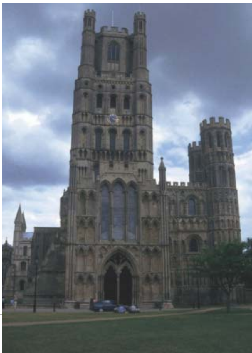
写真-2 イーリー大聖堂

建設はノルマン王朝成立後の1083年、内陣を再建することからスタートし、これは1106年に完成した。続いて交差廊と外陣工事に取組み、外陣は1180年頃、西交差廊をもつ西正面とポーチが13世紀初頃にできあがる。交差部には当初塔屋が立てられたが1322年に倒壊し、それを機に大聖堂の役