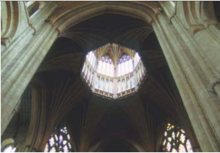
写真-3 交差部の八角塔屋

員の一人、ウォルジンガムのアランが交差部を八角形に改めた。13世紀までの十字交差部は単純な矩形に過ぎなかったが、このアランの試みは新たな造形への可能性を拓いたといえる。この八角形