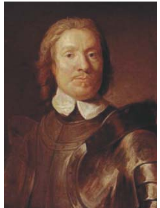
写真6 クロムウェル肖像画

クロムウェルは議会派の中心人物として、王党派と激しい攻防を繰り返した。1645年ネーズビーの戦いを制すると一気に優位に立ち、ついに1647年チャールズ1世は降伏を余儀なくされる。クロムウェルはさらに王と妥協をはかる長老派を武力によって議会から追放。国王を処刑し、共和政を樹立する。いわゆる