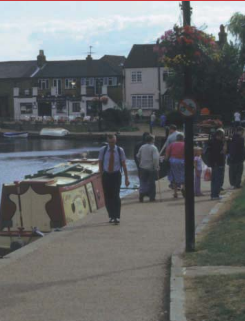
写真-8 ウース川河畔

いくつかの中世起源のヨーロッパの町を訪ねると、ほどよい幅の曲がりくねった道が縫うように走っており、まるで迷路にいるようだ。しかし町のどこからも教会を望むことができるので、迷子になることはない。そして町の規模と教会の規模はなんとなく相関があるようで、大きな町には巨大な大聖堂が屹立している。フィレンツェのドゥオーモ、パリのノートルダムなどは、大都市ならではの規模を誇っている。