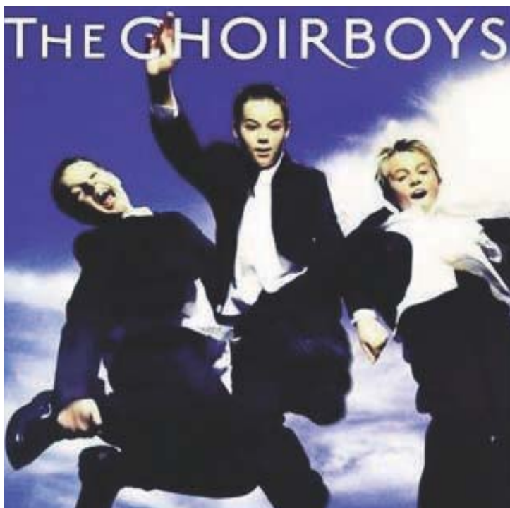
写真-1 クワイヤーボーイズ(CDアルバムのジャケットから)

さて、この聖歌隊の活動拠点であるイーリー大聖堂、この教会は西洋建築史におけるイギリス・ロマネスクやゴシック教会堂の項目で必ず取り上げられる超メジャーな建築であって、大学町ケンブリッジの北東約25キロメートルにあるイーリー(Ely)という小さな町に聳え立っている。今回はこのイーリーという魅力的な中世都市を紹介しよう。